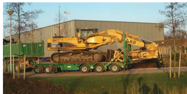
35 ton nuttig De nieuwe vijfasser van Burg heeft een wettelijk laadvermogen van 35 ton en een technisch laadvermogen van 46 ton.

Burg, Fabrik van Wegtransportmiddelen B.V. Katwijklerlaan 75 2641 PD Pijnacker Tel.: (015) 369 43 40