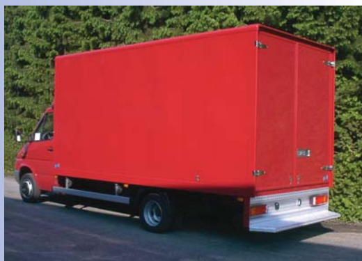
Eigen ontwikkeling Ducarbo ontwikkelde zelf een nieuwe lichte carrosserie.

teem.' Bij dit systeem wordt de lading geborgd met een dekzeil dat opgeblazen kan worden met behulp van lucht. Voordeel hiervan is dat de complete bovenbouw van de carrosserie overbodig wordt, wat fors scheelt in gewicht. Verder laat Ducarbo haar zelf ontworpen Ducarbo Lightbox zien. Het gaat hier om een lichtgewicht gesloten carrosserie speciaal voor bedrijfswagens tot 3500 kg. Ook heeft Ducarbo onder licentie van Terra-Truck een nieuw laad- en lossysteem gebouwd, dat in Hardenberg te zien zal zijn. ■