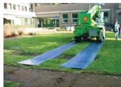
Kunststof Mesken levert kunststof rijplaten. Die zijn lichter en roesten niet.

Constructiebedrijf Mesken houdt zich onder andere bezig met levering en inbouw van hydraulische aggregaten op trucks, autolaadkranen en bergingskranen. Daarnaast levert men spat-schermen, stempelplaten en kunststof rijplaten. ■