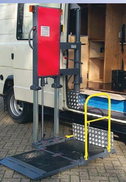
Opgeborgen Voorbeeld van één van de door GLT geleverde bestelautoliften.

MBB Liftsystems AG uit Duitsland, Car-Co Lift uit België en AMF Bruns uit Duitsland zijn de drie merken autolaadkleppen die GLT Interlift in ons land vertegenwoordigt. Men beschikt onder andere over diverse lichte laadkleppen die speciaal geschikt zijn voor bestelauto's. In verband met de nieuwe ARBO-tilnorm zijn dergelijke liften momenteel zeer gewild. In Hardenberg toont GLT AMF-binnenliften en van MBB de Minifix 500 uit het lichte programma. ■