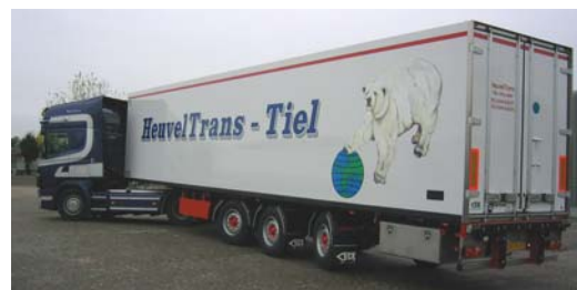
Wendbaar Door de meesturende assen is de oplegger ook nog beter wendbaar.

Van Eck B.V. Oude Waag 24 4153 BV Beesd Tel.: (0345) 68 61 00