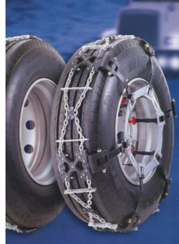
Zelfbevestigend De nieuwe Lorry Fix Trak zet zichzelf vast.

Evert Hammink Truck & Trailerparts Van Weerden Poelmanweg 14 7602 PC Almelo Holland Tel. (0546) 86 66 99