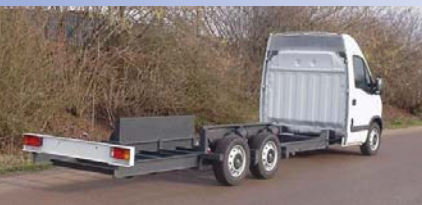
Winkelwagen De VB 6x2 is vooral geschikt voor winkelwagenopbouw.

Sinds enkele maanden bezit VB-techniek in Varsseveld de officiële RDW-status van 'Fabrikant bedrijfswagenchassis', waardoor de speciale voertuigen die dit bedrijf maakt voortaan onder eigen naam kunnen worden ontwikkeld, gekeurd en gekentekend. Daardoor kan VB-techniek in de toekomst in eigen beheer nog meer speciale voertuigen ontwikkelen. Kern van het 'eigen' programma is de VB 6x2 die op dit