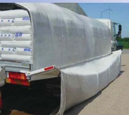
Onder zeil Zeil in plaats van een carrosserie bespaart vele kilo's gewicht.

Ducarbo, een samenwerkingsverband van carrosseriebouwers, exposeert op Hardenberg een speciale opbouw genaamd 'Airwrapping Vrachtsys-