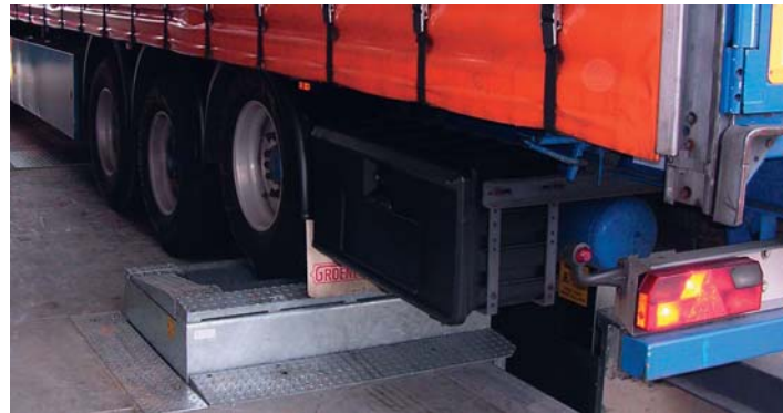
Een van de noviteiten bij Autec is een hefstelsel voor remtestbanken.

Autec komt in Gorinchem met twee nieuwe producten. Het eerste is een prefab put voor remtestbanken in de afmetingen 10,6 x 1,0 x 0,45 meter (inwendig). Met de prefab put kunnen de kosten voor plaatsing van een remtestbank worden gereduceerd. Er zijn trouwens ook langere uitvoeringen mogelijk: tot 15 meter om precies te zijn. Op aanvraag kan het zelfs nog langer. De prefab put is voorzien van een uitsparing voor de remtestbank, een ladder, een steektrap, afzuigvoorziening op de bodem en acht nissen voor de verlichting. Nieuw is verder het VLTTest Hefstelsel voor onder de remtestbank. Het gaat daarbij om het testen van tandemas en driessige voertuigen waaronder lege trailerchassis. De maximale capaciteit is 20 ton met een hefhoogte van 250 mm. Het hefstelsel onder de remtestbank is speciaal ontwikkeld om 'trekken' aan het chassis bij het uitvoeren van de rem-