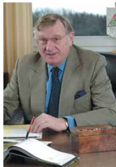
Always in de picture

Krone heeft aan zo ongeveer alle modellen uit het programma hele series verbeteringen doorgevoerd. Een greep daaruit: de Profi Liner schuifzeiloplegger wordt