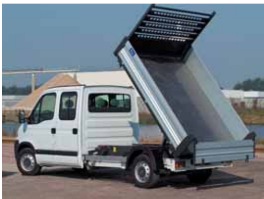
Kiepen Ook de Movano is vernieuwd. Deze heeft nieuwe motoren gekregen en blijft als vanouds leverbaar in vele chassis- en carrosserievarianten.

Aan de buitenzijde moet je bij de Vivaro drie maal kijken om te zien wat er nu precies veranderd is. Hier komen alle updates: de koplampen zijn opnieuw ontworpen en ogen nu wat agressiever, terwijl de grille verrijkt is met een chromen strip. De bumper aan de voorzijde komt iets meer naar voren om plek te bieden aan het nieuwe roetfilter. Aan de achterzijde hebben de achterlichten nu