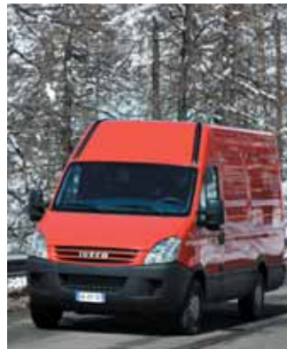
Voor het eerst Iveco staat voor het eerst op een beurs met de nieuwe Iveco Daily.

het "Transport Concept", een prototype van een trekker met oplegger op basis van de Stralis met vele innovaties. Verder staat er de FIDEUS, een voertuig dat ontworpen is op basis van een CNG (aardgas) Daily in het kader van een project van de Europese Commissie: "Freight Innovative Delivery of Goods in European Urban Space". ■